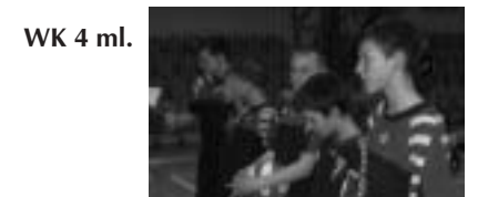
WK 4 ml.