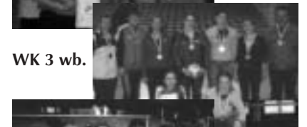
WK 3 wb.