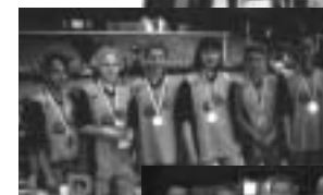
WK 4 wb.