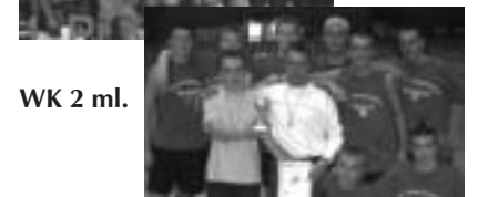
WK 2 ml.